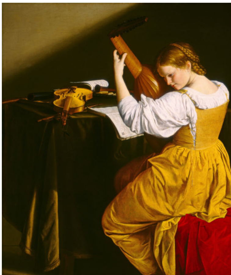
Målning av Orazio Gentileschi